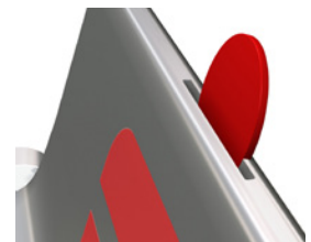
Rohlingsdetail „Red Nose“

Oder Sie binden die regionalen Sportvereine ein. Sei es Fußball, Handball, Tennis oder Hockey..., jedes Clubhaus oder Stadion kann durch Sparbänke verschönert werden! Neue „Trainerbänke“ oder