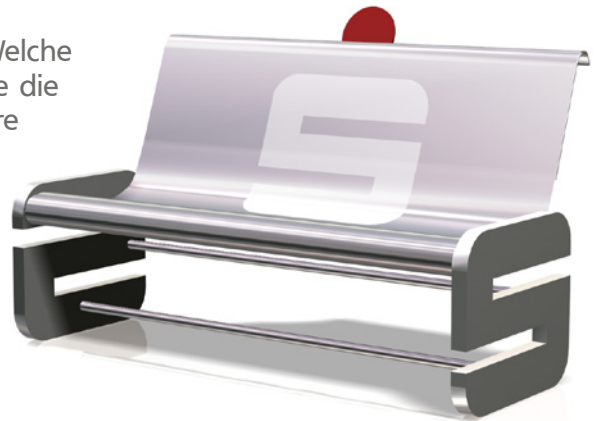
Rohlingsvariante „Red Nose“

Ihre Antworten auf diese und weitere Fragen versetzen uns in die Lage, unser Konzept Ihren Bedürfnissen entsprechend optimal auszurichten.