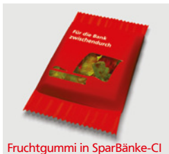
Fruchtgummi in SparBänke-Cl

Abgerundet wird unser Konzept durch weitere Dienstleistungen in Sachen Kommunikation und Marketing: Gerne organisieren wir für Sie z.B. die verschiedenen Events, die der Kampagne einen noch pressewirksameren Rahmen geben, insbesondere die wirkungsvolle Präsentation der fertig gestalteten Sitzmöbel.